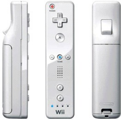
Figura 1: Il Wii Remote (Wiimote)

I led invece sono utilizzati per indicare il punteggio del giocatore e del robot, l'inizio e la fine di una partita.