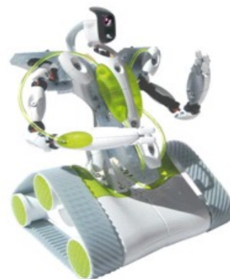
Figura 1: Spekee

Per collegarsi al computer Spykee crea una connessione wi-fi di tipo ad hoc ed è controllabile anche tramite il software proprietario fornito col robot.