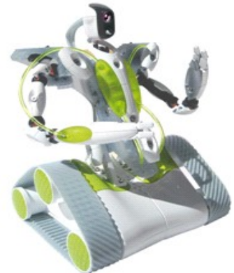
Figura 1: Spekee

Per collegarsi al computer Spykee crea una connessione wi-fi di tipo ad hoc ed è controllabile anche tramite il software proprietario fornito col robot.